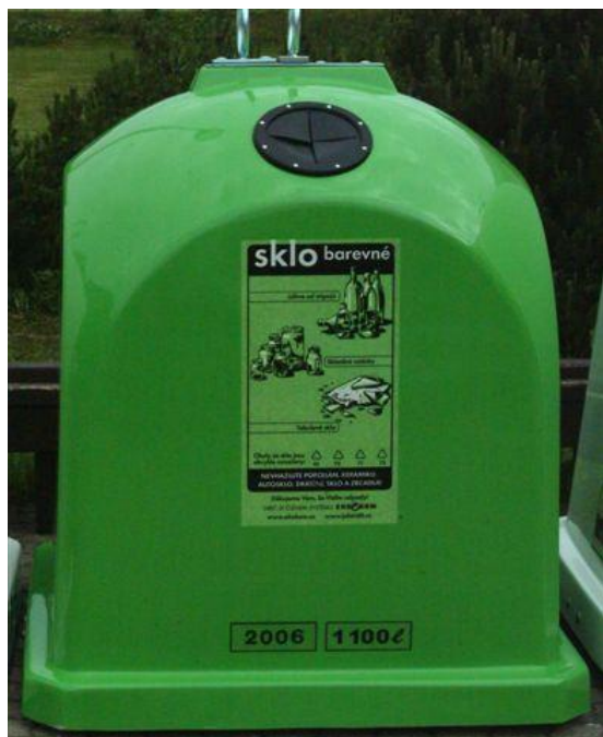
nádoba pro sběr barevného skla objem: 1 100 l spodní výsyp