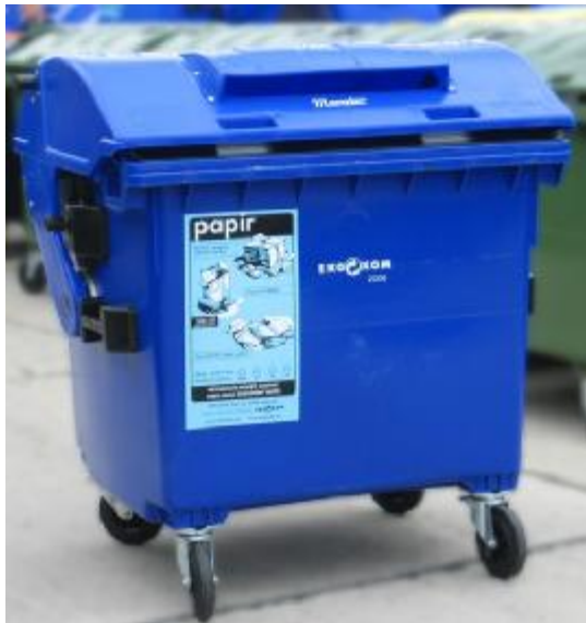
nádoba pro sběr papíru objem: 1 100 l horní výsyp

Ukázky nádob na separovaný sběr odpadu, které jsou umíst'ovány v rámci krajského projektu Čistá obec, čisté město, čistý kraj.