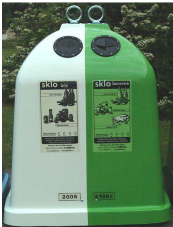
dělená nádoba pro sběr bílého a barevného skla objem: 2 100 l spodní výsyp