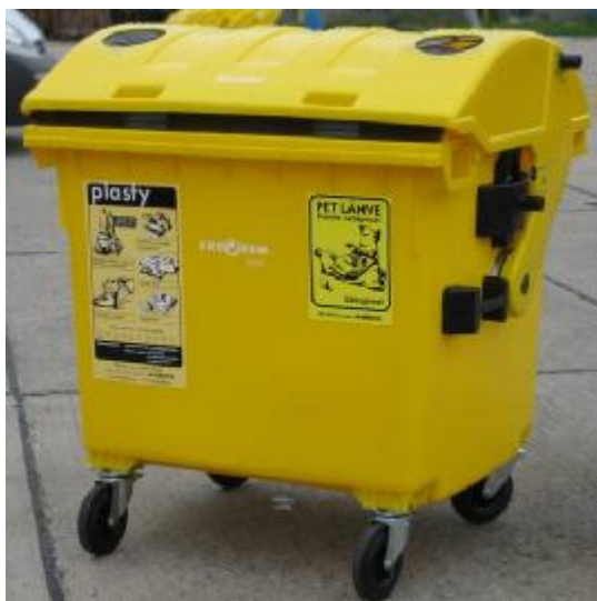
nádoba pro sběr plastů objem: 1 100 l horní výsyp